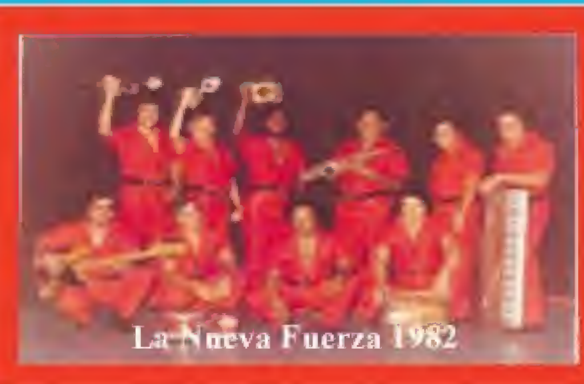
La Nueva Fuerza 1982